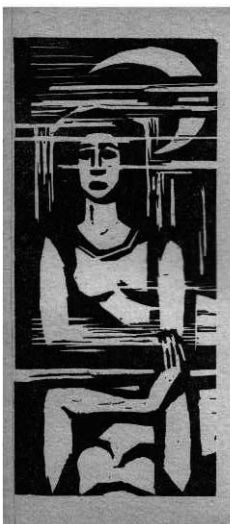
6. Drzeworyt I. Kuran-Boguckiej do poezji F. Garcíá-Lorki, przykład ilustracji wprowadzającej w nastrój. Za: Garcíá Lorka F., Poezje . Wydaw. Morskie, Gdańsk 1982.