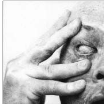
5. Grafika komputerowa – Z. Beksiński „Bez tytułu”. Za: www.stumbleupon.com/url/www.beksinski.pl