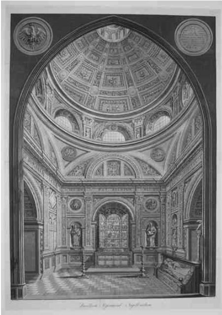
4. Akwatinta z akwafortą – „Wnętrze Kaplicy Zygmuntowskiej”.