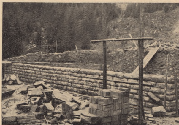
Fragment budowy schroniska.

Trwają też prace, w wyniku których harcerskie narciarstwo będzie miało własne schronisko. A mianowicie: