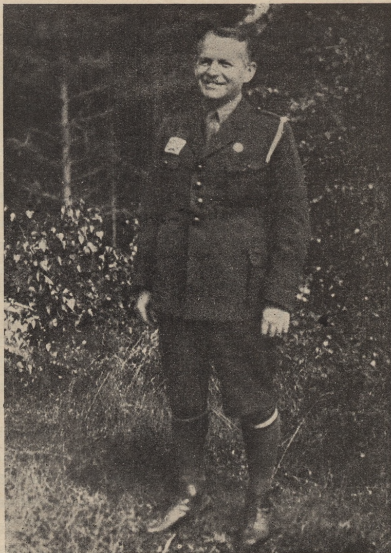
PRZEWODNICZĄCY Z. H. P. Dr. Michał Grażyński Wojewoda Śląski

MIĘSIĘCZNIK INSTRUKTOREK HARCERSKICH ORGAN GKZ ZHP