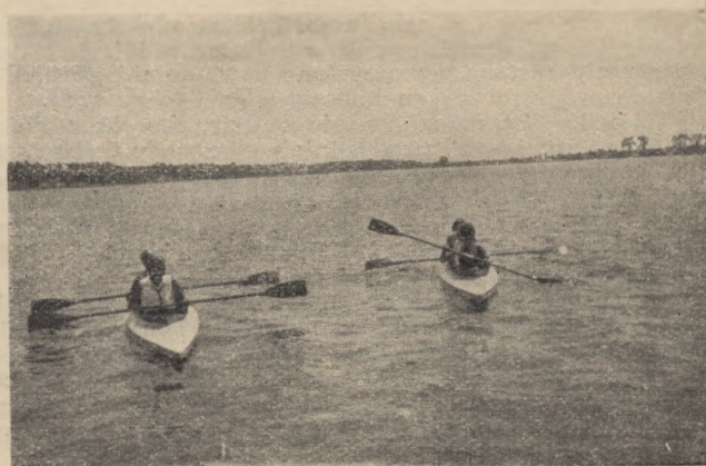
... A czasem było wolno pojechać kajakiem ...

Same mieszkamy w lesie tuż nad cudnym jeziorem, do którego nas wprowadzie o wiele zamało puszcza ale zawsze puszcza. Cały dzień wychowują nas fizycznie. Praca zaczyna się od ranej, gimnastyki, a potem idą gry ruchowe, lekka atletyka, kąpiel, nauka pływania, gry sportowe, wszystko przeplatane wykładami z teorii gimnastyki i anatomii. Do tego wszystkiego przypieka słońce niemiłosiernie, plecy i ramiona niejednej z nas to prawie skwarek, a tu skacz, graj w siatkówkę lub inną morderczą grę jak hazena. Pierwszy tydzień był dla mnie niewymownie forsowny. Zanim się przyzwyczaiłam do tego nowego trybu życia, do tego