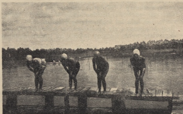
... gotowe przed chlubą naszego obozu—plywalnią ...

Chciałam być zwykłym szaraczkiem, a tu przydzielono mi funkcję zastępowej. Oto mieszkam ze swoimi pupilkami w dużym hangarze, mamy