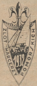
Oznaka Złoty Harcerz Pomorskich 1932 r.

Pieczęć okrągła — z krzyżem harcerskim w środku z napisem dwujęzycznym dookoła.