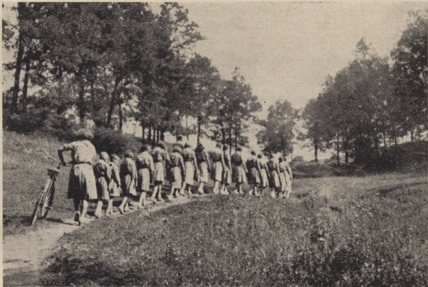
Wymarsz na wycieczkę

MIĘSIĘCZNIK INSTRUKTOREK HARCERSKICH ORGAN GKZ-ZHP