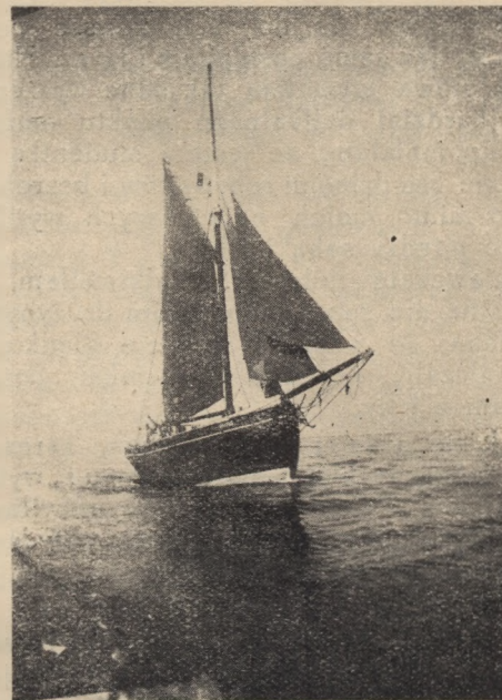
Żeglarstwo uprawia 60 druhen.

bardzo wygodnie, nosimy piękną nazwę „Admirałów” i zbieramy często bury. Oto zeszyły się w naszym zastępie rozmaite zakątki Polski jak: Częstochowa, Rypin, Gdynia, Dobrze, Inowrocław i dwie drużyny z Łotwy. Oprócz tego przydzielono nam jako współlokatorki dwie panie ze szkoły Sztuk Pięknych, były to krótko mówiąc „sztuki piękne”.