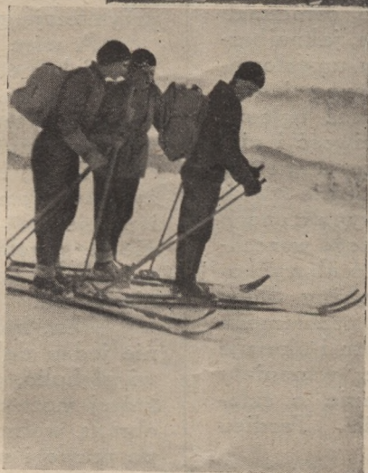
NA BABIEJ GÓRZE

MIEŚIĘCZNIK INSTRUKTOREK HARCEERSKICH ORGAN GKZ ZHP